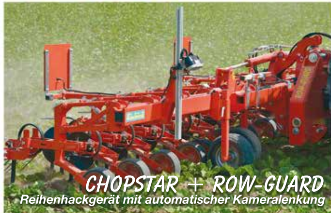
CHOPSTAR + ROW-GUARD Reihenhackgerät mit automatischer Kameralenkung

über 30 Jahre Erfahrung im biologischen Landbau